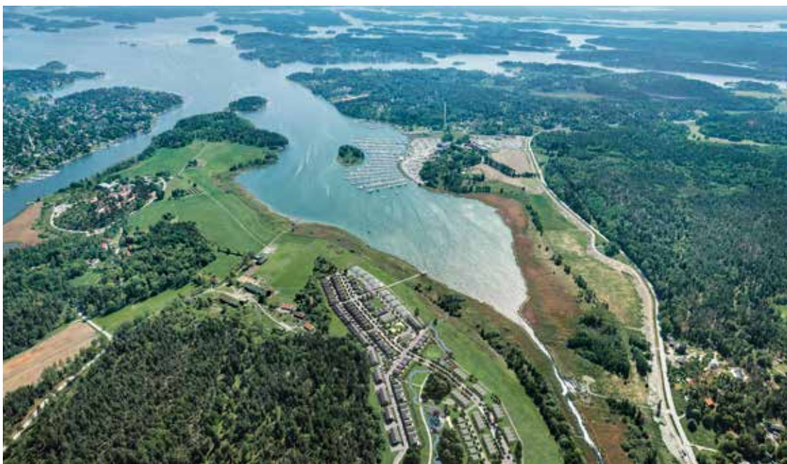
SKÄRGÅRDSIDYLLEN NÄRA STOCKHOLM

På Täljöhalvön får du det bästa av två världar, med naturen som granne och centrala Stockholm bara en halvtimma bort. I den moderna skärgårdssidyllen finns snart ett gemensamt torg med bland annat boulebana och scen. Och för dig med spring i benen kommer även en aktivitetspark med klätterbana och bollplan att finnas på plats under 2020.