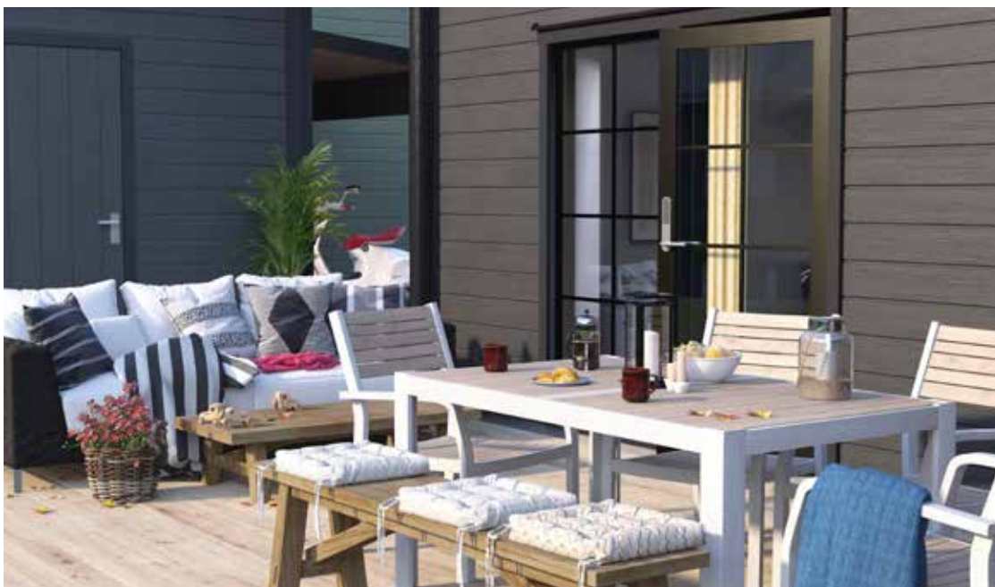
MODERNA HEM MED SPRÖJSADE FÖNSTER

I Pionen kommer du hem till ett modernt hus med två våningar samt trädgård och altan. Grannskapet består av äganderätter som kedjehus, radhus och fristående hus med 5 rum fördelat på 121–158 kvadratmeter. Vad söker du? Här finns olika hus, till olika pris – för olika behov.