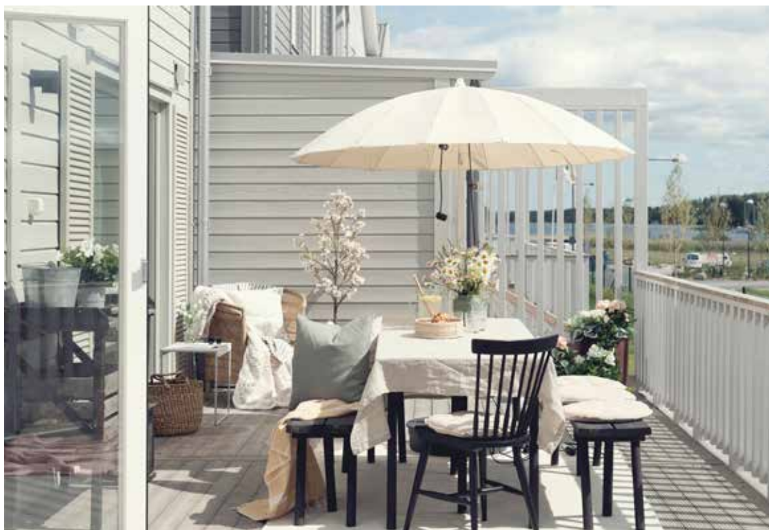
FAMILJEVÄNLIGA HEM I SOLIGT LÄGE