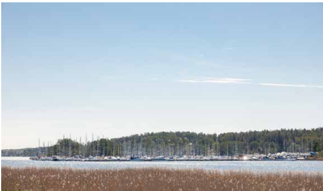
SKÄRGÅRDSIDYLLEN NÄRA CITYPULSEN

Välplacerat intill Täljöviken och bara en halvtimme från Stockholm fortsätter Täljohalvön att växa med aktivitetspark och skolor. Här kan du bada i havet eller packa picknickkorgen för utflykter i skogen. Välkommen till en riktig skärgårdssidyll.