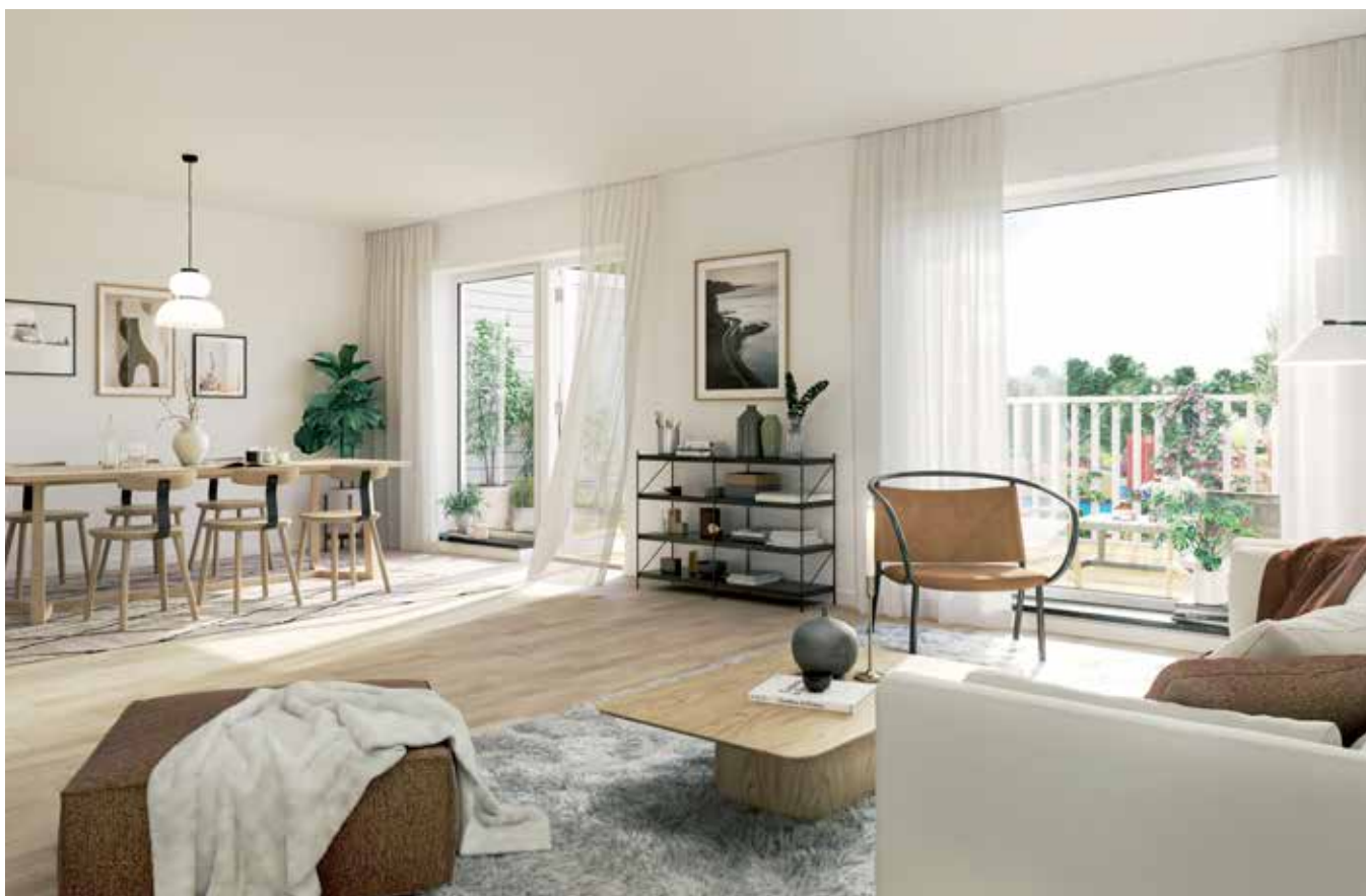
ÖPPEN OCH LJUS PLANLÖSNING