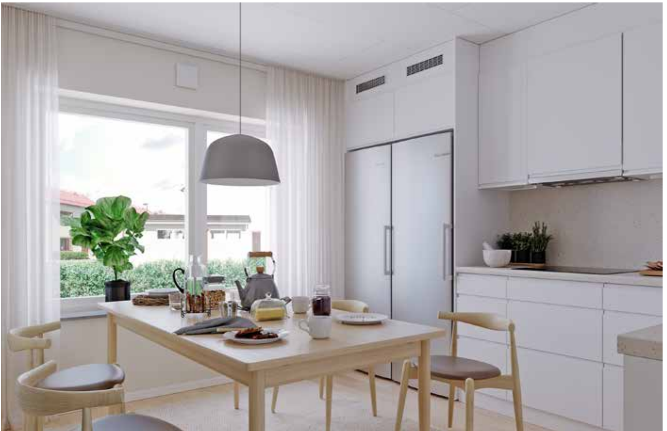
KÖK MED MATPLATS