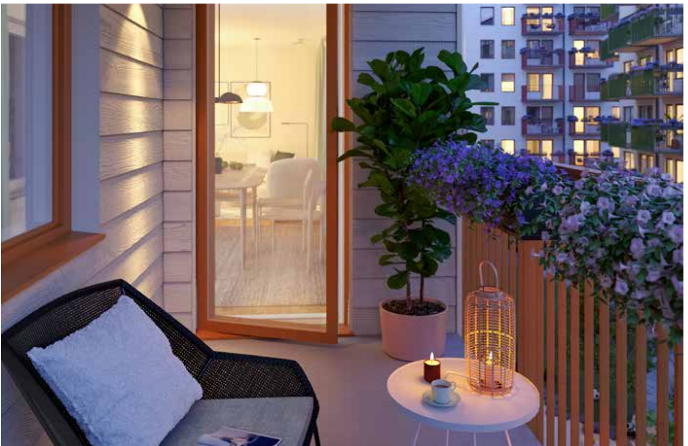
EGEN BALKONG FÖR BÅDE UMGÄNGE OCH EGENTID