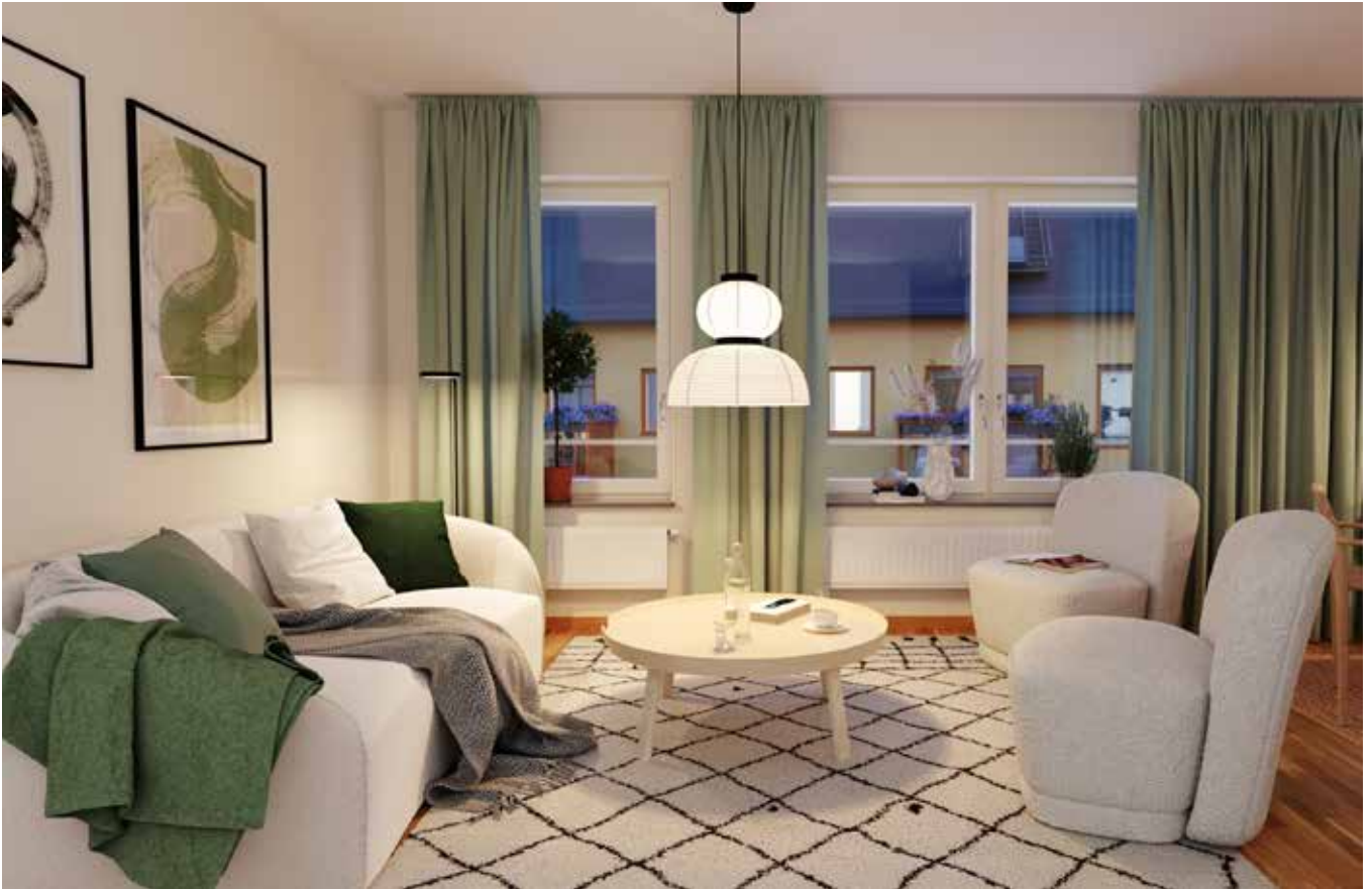
RYMLIGT VARDAGSRUM FÖR MYSIGA HEMMAKVÄLLAR