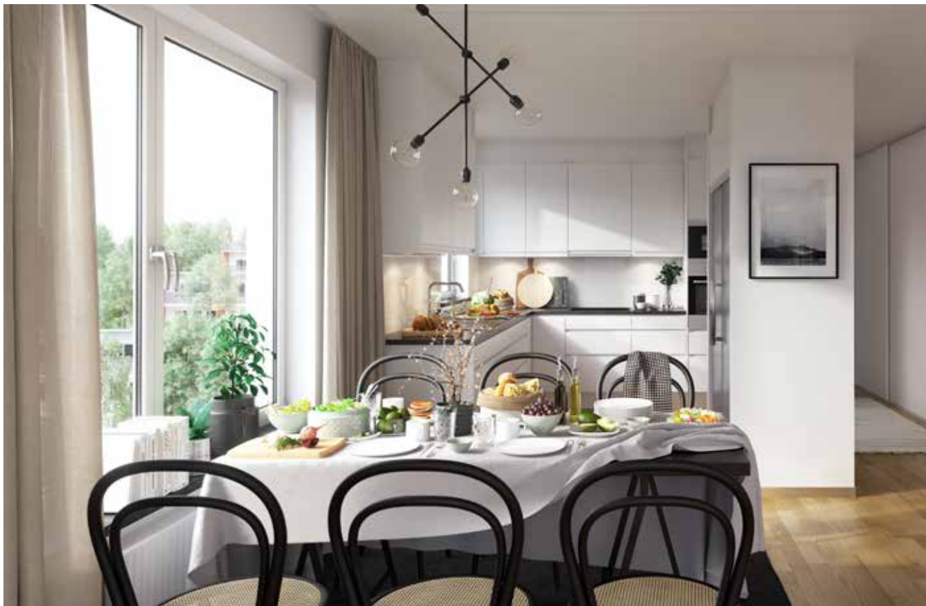
MINIMALISMKÖKET MED TILLVALSPAKETET SYNLIGT