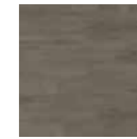
Varmgrå ek, 3-stav