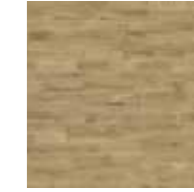
Ljusbrun ek 2-stav