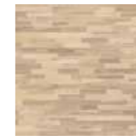
Vitpigmenterad ask, 3-stav