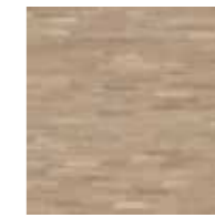
Vitlaserad ek, 3-stav