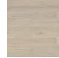
Vitlaserad ek, 1-stav